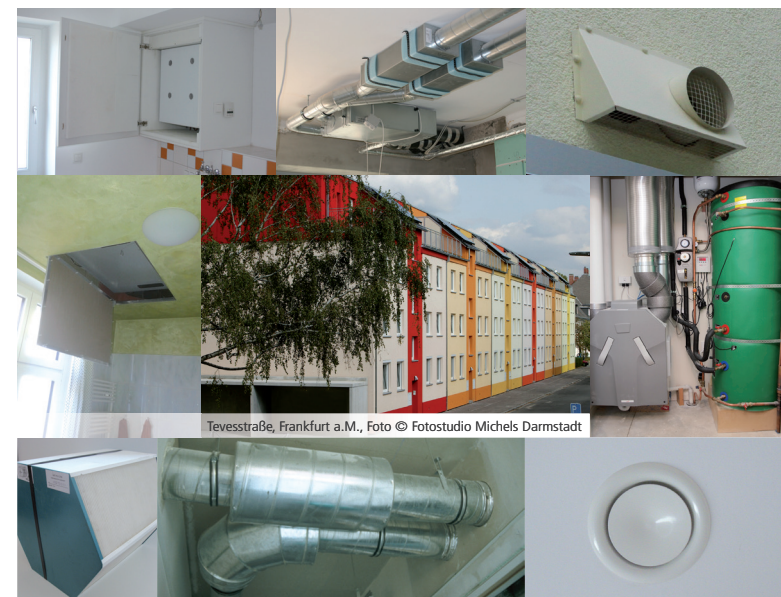
Tevesstraße, Frankfurt a.M.